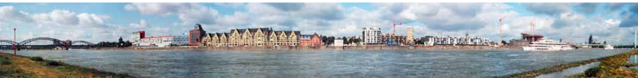
WAPPEN VON KÖLN