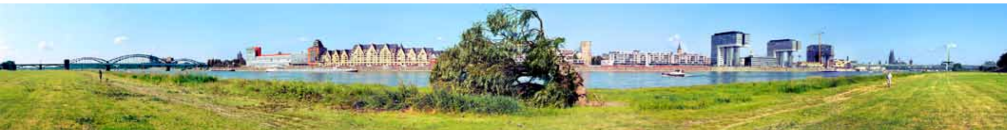
Weiden-Trilogie: DAS ENDE DER WEIDE