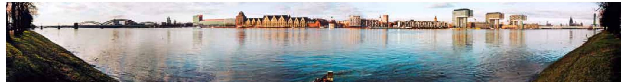
Hochwasser-Trilogie: HOCHWASSER 2011