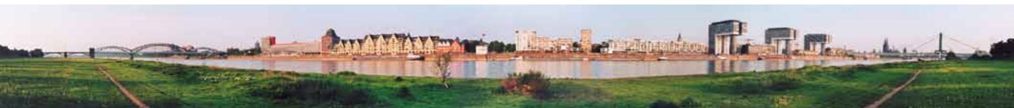
Weiden-Trilogie: DIE NEUE WEIDE