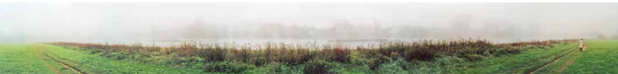
FRAU MIT HUND