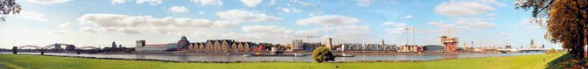
Weiden-Trilogie: STOLZE WEIDE