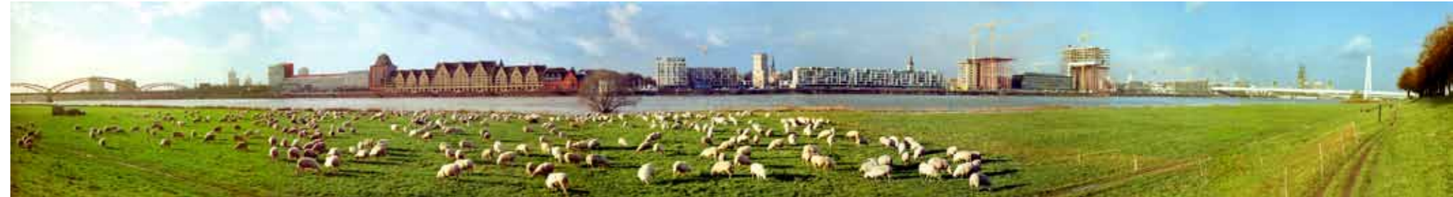
STARE UND SCHAFE